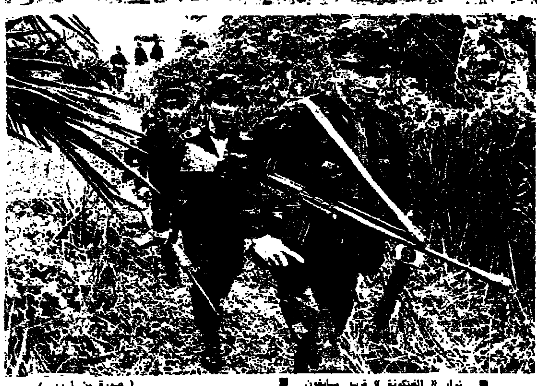
ثوار « الفيتكونغ » قرب سايفون

اجمع المراتبين على ان الانتصار التاريخي الذي حققته ثوار « الفيتكونغ » في فيتنام الجنوبية هذا الاسبوع ، قضى على اسطورة القوة الاميركية التي لا تقهر . لقد استطاع شعب مضم على تحرير بلاده . ان ينتصر على الوف الطائرات ومئات الألوف من الجنود المزدومين بأحدث الاسلحة وأكثرها فتكاً وتدميراً . الوجود الاميركي في فيتنام الجنوبية انتهى الى الابد ، وحكام سايفون انهزموا مع قواتهم امام الثوار الزاحقين ، واستسلموا بدون قيد او شرط ... ولم يبق من القوة الاميركية سوى « فزيرة » كان الجنود الجنوبيون قد نصبوها في حقل قرب سايفون لمحاولة خداع « الفيتكونغ » وتخويلهم ( الصورة اعلاه ) . هذه « الفزيرة » التي صنعوها من ملابس جندي مشحوة بالفتش ، وربطوها بماسورة مدفع بازوكا ، ووضعوا خوذته وكمامة فوقها ... تبدو وكأنها تمثيل كسل ما تبقى من القوة التي حاولت اخضاع شعب فيتنام ... مجرد جندي من قش قد يصلح لإبعاد الفرمان عن حقول الزرع ، ولكنه بالتأكيد لا يصلح لتخويل الشعوب وإبعادها عن أرضها وحقوقها . ( تحقيق على الصفحة ٩ )